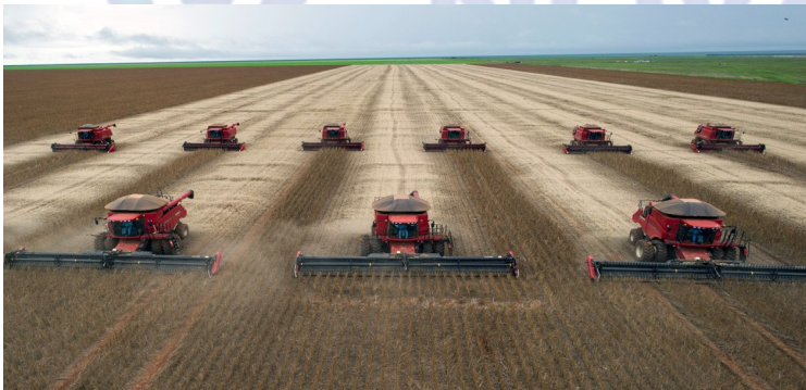
Cidadã refugiada do congo (Foto—05/2017)

A economia brasileira voltou a crescer após oito trimestres seguidos de queda. Nos três primeiros meses de 2017, o Produto Interno Bruto (PIB) avançou 1,0% em relação ao 4º trimestre do ano passado, segundo dados divulgados nesta quinta-feira (1º) pelo Instituto Brasileiro de Geografia e Estatística (IBGE). Em 2016, a economia "encolheu" 3,6% – confirmando a pior recessão da história do país.