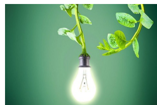
Energia e sustentabilidade (Foto—06/2017)