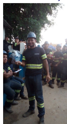
Sorteio de brindes Oral-b (Foto 06/2017)

No mês de Maio, o Consórcio Nova Norte conquistou seus colaboradores com mais uma palestra nova e cheia de surpresas— Higienização Bucal .