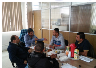
Reunião de líderes (Foto—05/2017)

fiscalização diária que está sendo feita pelos fiscais e Encarregados.