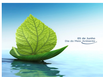
Dia do meio Ambiente (Foto—06/2017)

O dia do meio ambiente que é comemorado em 5 de Junho, tem como objetivo principal chamar a atenção de todas as esferas da população para os problemas ambientais e para a importância da preservação dos recursos naturais, que até então eram considerados, por muitos, inesgotáveis.