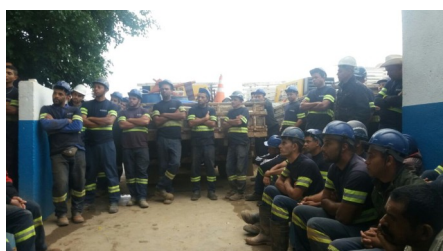
Equipe do Consórcio Nova Norte em DDS sobre 5S (Foto—06/2017)

A metodologia 5S tem sido desenvolvida de forma eficaz e participativa nas empresas através de fundamentos de fácil compreensão e capacidade de apresentar resultados expressivos. Isso responde a questão daqueles que se perguntam: “por que cada vez mais empresas investem na aplicação dos 5S?” A resposta é simples: porque é uma ferramenta baseada em ideias simples e que podem trazer grandes benefícios para as empresas.