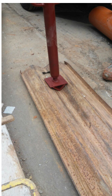
Estroncas em testes (Foto—08/2017)

Na última semana do mês de Julho, foi concluído pela equipe responsável que os testes realizados tiveram êxito, pois além de todas as qualidades mencionadas pela estronca, a compra de madeiras para trabalhos de escoramentos de vala será quase zero, abaixando o custo-mês em mais de 50% no que se refere a madeira.