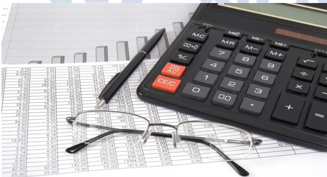
Créditos e empréstimos bancários (Foto—08/2017)

Depois de entregar a declaração do Imposto de Renda, muitos brasileiros aguardam com ansiedade o depósito da restituição do imposto. O problema é que ninguém sabe se vai estar no primeiro ou no último lote de pagamentos.