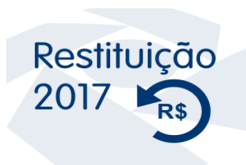
RESTITUIÇÃO 2017 (Foto-08/2017)

Para saber se teve a declaração liberada, o contribuinte deve fazer a consulta no site