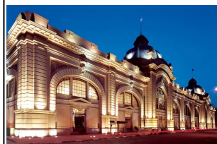
Mercado Municipal de São Paulo (Foto—08/2017)

Conrado Sorgenicht Filho, famoso pelo trabalho realizado na Catedral da Sé e em outras 300 igrejas brasileiras. Ao todo, são 32 painéis subdivididos em 72 lindos vitrais.