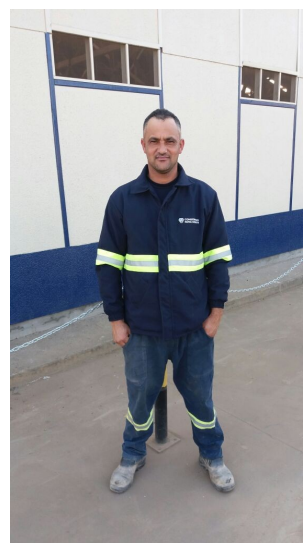
Jaquetas entregues (Foto—08/2017)

Neste mês de agosto, os colaboradores do Consórcio foram contemplados com as Jaquetas confeccionadas, onde possui o logo do consórcio e faixas refletivas para efeitos de segurança.