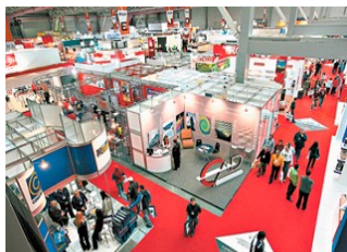
Premiação-SABESP 2017 (Foto—09/2017)

Neste mês de Setembro, o Consórcio Nova Norte partici-