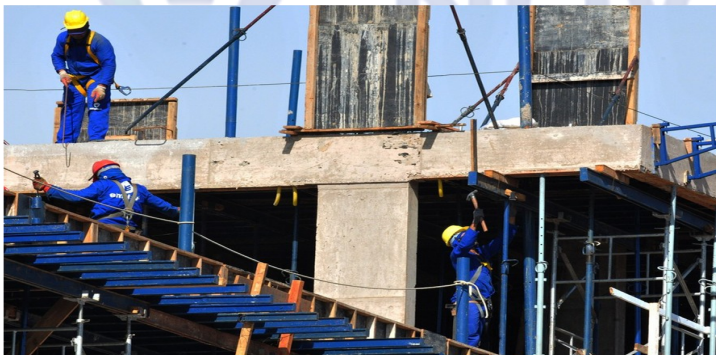
Construção Civil 2017 (Foto—09/2017)

O Índice Nacional da Construção Civil (Sinapi) variou 0,23% em agosto, ficando 0,35 ponto percentual abaixo dos 0,58% do mês de julho, segundo divulgado pelo Instituto Brasileiro de Geografia e Estatística (IBGE) nesta quarta-feira (6).