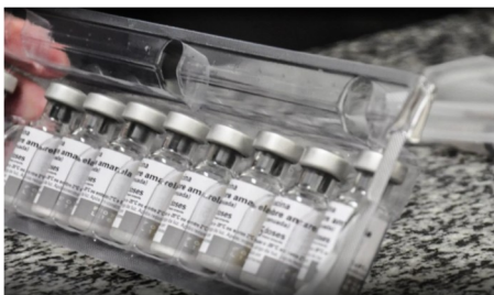
Vacina contra a febre amarela (Foto—09/2017)

Ministério da Saúde anunciou nesta quinta-feira (6) o fim do surto de febre amarela no País. Segundo a pasta, desde junho não há registro de novos casos. Ao todo, foram 777 casos e 261 mortes entre dezembro de 2016 e agosto de 2017.