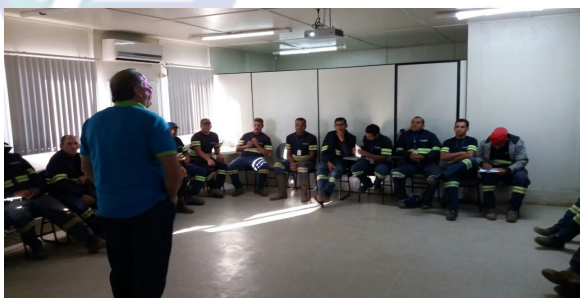
Curso "Sempre alerta /COMGÁS" (Foto—09/2017)

No último dia 04/09, o Consórcio Nova Norte promoveu um dos treinamentos fundamentais para as execuções de obras em vias públicas, o curso "Sempre Alerta" reali-