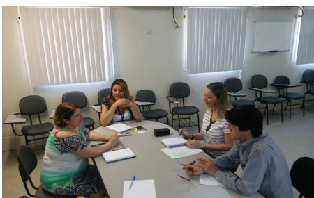
Reunião de alinhamento e processos (Foto—09/2017)

Em Julho de 2017, o Consórcio Nova Norte assinou o novo contrato que atenderá a região de Tucuruvi. Sendo assim, uma reunião entre RH, QSMS e Sumaré Ocupacional (Empresa terceira responsável pelos laudos e exames complementares) foi realizada para padronização de documentos e ajustes técnicos.