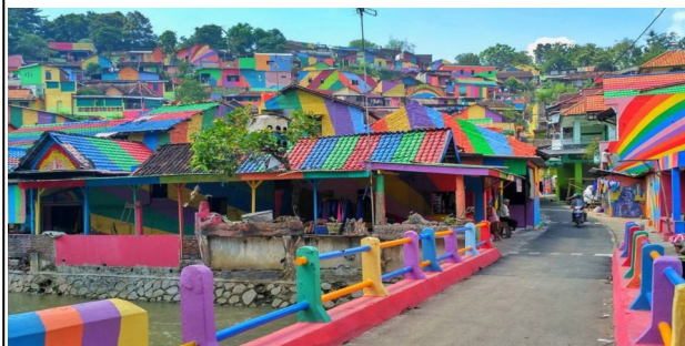
Ilha de Java-Indonésia (Foto—09/2017)

Uma aldeia indonésia atrai muitos turistas e curiosos desde que pintou todas as suas casas de várias cores, ganhando o apelido de "Aldeia arco-íris".