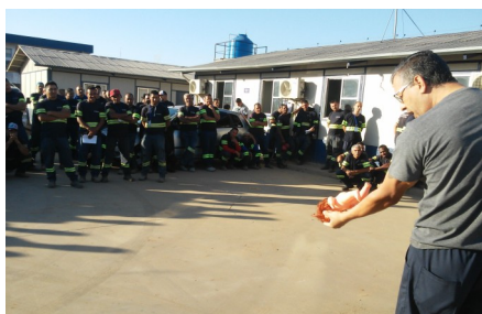
Reunião de alinhamento e processos (Foto—09/2017)

O Consórcio Nova Norte promoveu no último mês de Novembro o treinamento de Primeiros Socorros, capacitação que conscientiza os colaboradores em situações delicadas como: