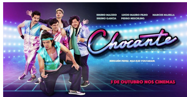
“Chocante” o filme (Foto—10/2017)

Vinte anos depois do sucesso meteórico do grupo chocante com o hit choque de amor, Téo (Bruno Mazzeo), Tim (Lucio Mauro Filho), Toni (Bruno Garcia) e Clay (Marcus Majella) se reencontram. Entre as loucuras da juventude e o presente sem nada a perder, surge a ideia de fazer um novo show para a felicidade da eterna líder do fã clube Quézia (Débora Lamn). Orientados pelo prestigiado empresário Lessa (Tony Ramos), os amigos retomam os ensaios com o novo integrante Rod (Pedro Neschiling), vencedor de um decadente Reality show. Ninguém pediu, mas eles voltaram! O resgate desse grupo trará situações divertidíssimas e uma nova fã: Dora (Klara Castanho).