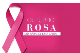
Outubro Rosa 2017 (Foto-10/2017)

Outubro Rosa é uma campanha de conscientização realizada por diversos entes no