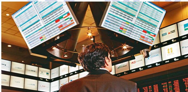
Bovespa 2017 (Foto—10/2017)

O principal índice da bolsa brasileira, o Ibovespa, opera em forte alta nesta quinta-feira (05/10), chegando a tocar os 78 mil pontos em apenas meia hora de pregão. O cenário econômico, que dá sinais de início de uma recuperação, aliado à alta liquidez no exterior, tem ajudado a manter o viés positivo.