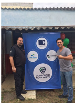
Trabalho voluntário final de ano—Consórcio Nova Norte (Foto—12/2017)

Na passagem de um ano ao outro, uma única certeza: a de que o tempo não nos pertence. Que da mesma forma como as galáxias estão fora de nosso alcance ou que o universo se expande ou encolhe sem que nada tenhamos a dizer, do mesmo jeito, imperturbável, o tempo se enrola e desenrola sobre si mesmo. O tempo não tem dono. Imortal, ele não para – cantava Cazusa. Enquanto isso, nos