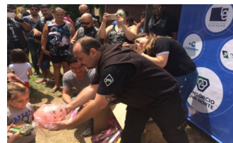
Entrega de presentes—Consórcio Nova Norte (Foto—12/2017)