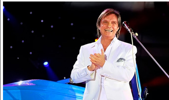
Show "Só para mulheres" cantor Roberto Carlos (Foto-12/2017)

Para comprovar a diversidade de programação da capital paulistana, é só olhar os shows que acontecem a cada semana. Do rock'n'roll a MPB, passando pelo pop, sertanejo, samba, jazz e soul, há opções de AP resentações para todos os gostos e bolsos.