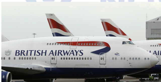
Aeroporto de Heathrow em Londres - (Foto—01/2018)

2017 FOI CONSIDERADO O ANO MAIS SEGURO JÁ REGISTRADO PARA VIAGENS AÉREAS