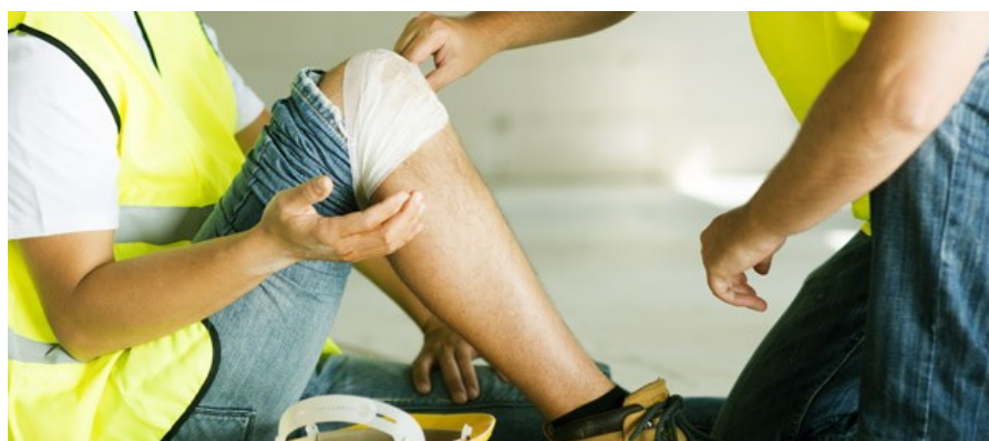
Acidente no trabalho (foto—01/2018)

Em vigor desde janeiro de 2010, o Fator Acidentário de Prevenção (FAP) é um instrumento para valorizar as empresas que investem na saúde e segurança de seus trabalhadores. Para entendê-lo, porém, é preciso voltar ao conceito de acidentes de trabalho e o que é feito para que as organizações valorizem essa área.