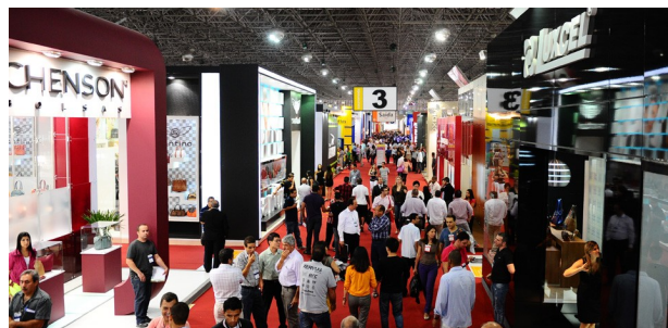
44ª Feira Couromoda 2017 (Foto—01/2018)

Sempre renovada, a Couromoda, evento líder em lançamentos e vendas de calçados e acessórios na América Latina, reúne lojistas de todo o Brasil e compradores globais, vindos dos principais centros consumidores do mundo.