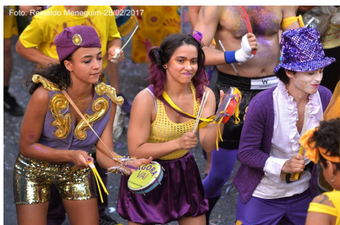
Blocos de rua—Zona Oeste de SP (Foto—02/2018)

A Zona Oeste já é destino certo para os carnavalescos de São Paulo, afinal Pinheiros e Vila Madalena são conhecidos por concentrar um montão de blocos. Mas em outros bairros, como Lapa, Perdizes, Pompeia e Barra Funda, também tem carnaval! Selecionamos os melhores blocos dessas regiões, anota a!