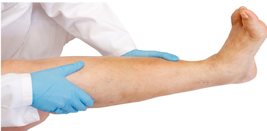
Tratamento de trombose (foto—02/2018)

Trabalhos em escritórios ou no comércio têm um ponto em comum: os empregados costumam passar tempos prolongados parados em pé ou sentados. Como faz parte da rotina, muitos não ligam para isso, mas esse é um dos principais fatores para o surgimento da trombose.