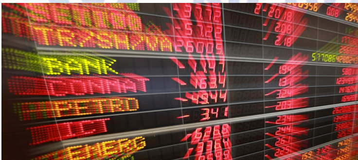
Bolsa de valores de Nova York - (Foto—02/2018)

Contaminadas pela retração de segunda-feira (5 de Fevereiro) da Bolsa de Valores de Nova York, nos Estados Unidos, as bolsas asiáticas também encerraram em baixa nesta terça (6 de Fevereiro). As bolsas europeias seguem a mesma tendência e operam em baixa na manhã desta terça-feira.