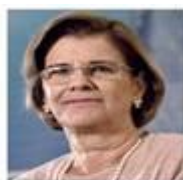
Ouvidora da Sabesp - P1

“ Poucas pessoas se manifestam quando a atuação é positiva. Por isso valorizo muito cada manifestação. Parabéns! ”